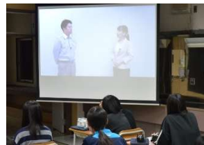
e-ラーニング【事前講習】受講の様子 11月20日(木)